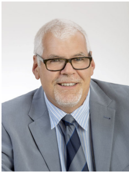
GR Karl Gruber Prüfungs-, Sozialaus- schuss 0676/7057670