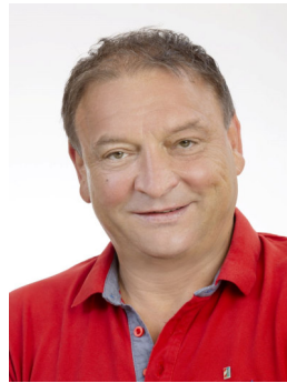
GR Andreas Gric Liegenchafts- u. Inf- rastruktur-, Bauaus- schuss 0664/8295720